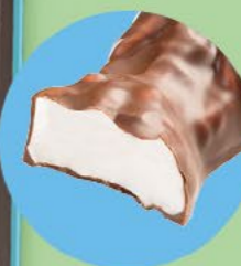
Un cœur tendre en guimauve enrobé de chocolat au lait

LA BOITE DE 28 LAPINS EN GUIMAUVE ENROBÉS DE CHOCOLAT AU LAIT** - 280 G NET