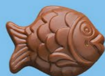
Chocolat au lait 36% de cacao