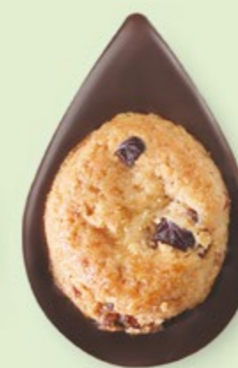
BISCUIT CRANBERRIES Chocolat noir 60% de cacao