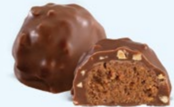
Praliné aux noisettes et éclats d'amandes, chocolat au lait 36% de cacao