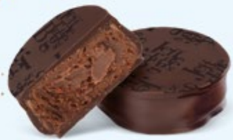
Ganache corsée de chocolat noir au cacao du Venezuela, chocolat noir 70% de cacao

Venezuela, Saint-Domingue, Équateur, Sao Tomé... Une invitation au voyage vers les plus fameuses origines de cacao.