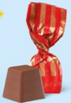
CHOCOLAT AU LAIT Praliné noisettes façon pâte à tartiner