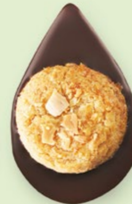
BISCUIT AMANDES Chocolat noir 60% de cacao