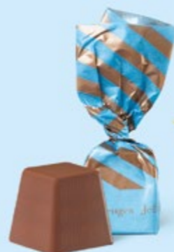
CHOCOLAT AU LAIT Praliné et sucre pétillant