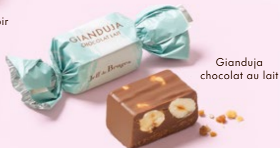
Gianduja chocolat au lait