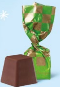
CHOCOLAT NOIR Praliné façon rocher aux éclats de noisettes