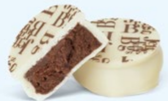
Puissante ganache de chocolat noir au cacao de Sao Tomé, chocolat blanc

BOITE DE 250 G NET 24 PALETS ASSORTIS 4 RECETTES