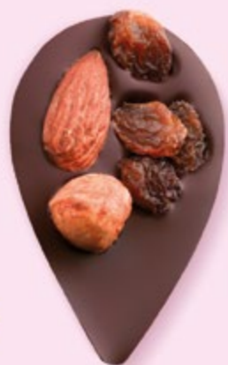
JULIETTE IN THE CITY Chocolat noir 60% de cacao, amande, noisette, raisins secs