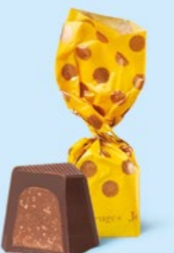
CHOCOLAT NOIR Praliné avec éclats de crêpe dentelle

BOITE DE 245 G NET 19 SUJETS ASSORTIS AU PRALINÉ 7 RECETTES