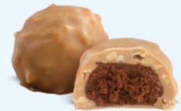
Praliné aux noisettes et éclats d'amandes, chocolat blanc caramélisé