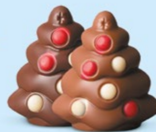
Praliné et sucre pétillant ou praliné et éclats de nougat

Nos choco'pralinés font partie de la magie de Noël. Ils plaisent aux petits... comme aux grands !