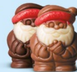
Duo praliné et caramel ou praliné et éclats de noisettes caramélisées