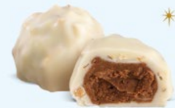
Praliné aux amandes et éclats d'amandes, chocolat blanc