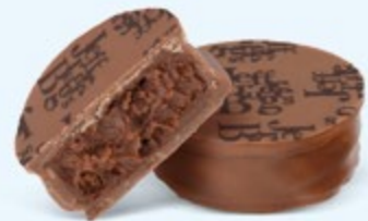
Ganache de chocolat noir au cacao fruité de Saint-Domingue, chocolat au lait 36% de cacao