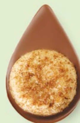
BISCUIT NOISETTES Chocolat au lait 35% de cacao

Un biscuit sablé artisanal posé sur un très bon chocolat ! C'est simple et c'est divin.