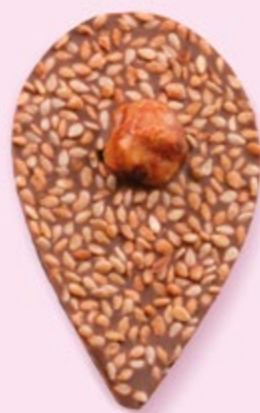
GRAINE DE JULIETTE Chocolat au lait 35% de cacao, sésame, noisette caramélisée