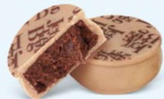
Ganache aromatique de chocolat noir au cacao d'Équateur, chocolat blanc caramélisé