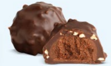
Praliné aux noisettes et éclats d'amandes, chocolat noir 60% de cacao