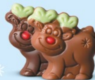
Praliné et éclats de noisettes torrifiées ou praliné et éclats de crêpe dentelle