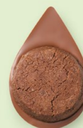
BISCUIT BROWNIE Chocolat au lait 35% de cacao

Les prix barrés sont les prix de vente TTC maximum en boutique. *Prix de vente TTC maximum.