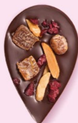
JULIETTE & TOM Chocolat noir 60% de cacao, dés d'abricots secs, amandes caramélisées et morceaux de cerise