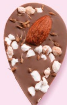
LE SONGE DE JULIETTE Chocolat au lait 35% de cacao, amande, éclats de nougat, brins d'anis